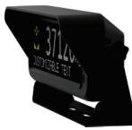
* OP-36 스탠드 브라켓